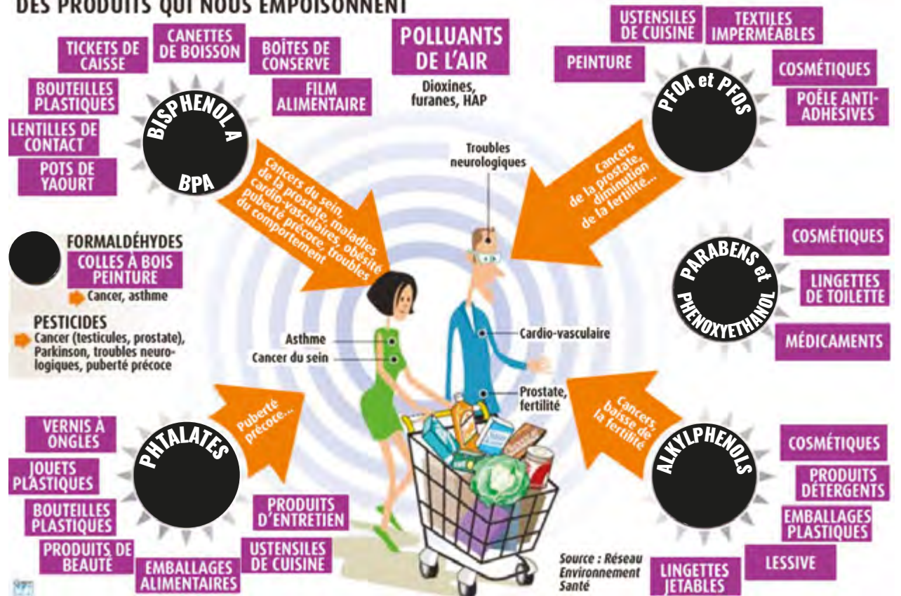
Source : Réseau Environnement Santé